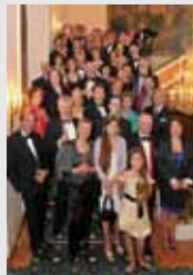
DK-Mitglieder und Gäste beim CINOA-Kongress 2009 in München.

Gemeinsam mit den Kollegen in den Verbänden des deutschen und europäischen Kunsthandels streitet der DK für die Verbesserung der Rahmenbedingungen auf dem deutschen Kunstmarkt und für die Aufhebung von Wettbewerbsnachteilen des Binnenmarktes gegenüber globalen Mitbewerbern.